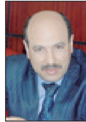
وكيل لائحة الكتاب