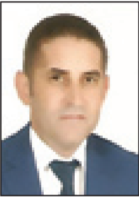
وكيل لائحة السنبلة