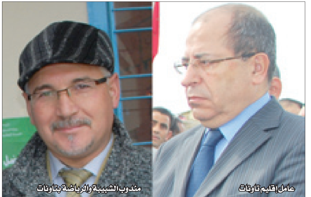
حامل إقليم تاوانات