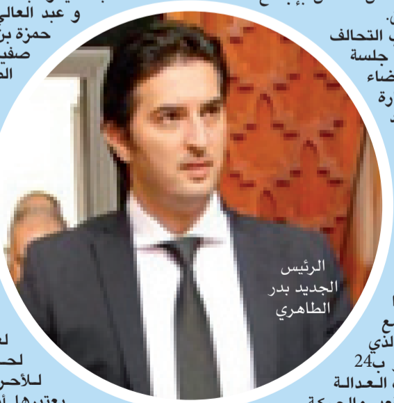
الرئيس الجديد بدر الطاهري

تجدر الإشارة أن رئيس الغرفة الجهوية للصناعة والتجارة والخدمات الجديد بدر الطاهري من مواليد سنة 1981 بمكناس، الشاعر لعضوية المكتب السياسي لحزب التجمع الوطني للأحرار؛ المنحدر من عائلة يعتبرها أهل الجهة من الأعيان الكبار، خريج إحدى المدارس العليا في التجارة من فرنسا، جاء إلى عالم السياسة قادماً من عالم المال والأعمال. الوافد على قبة البرلمان بعد استوزار صلاح الدين مزور، ومستشار في المجلس البلدي بمكناس، ونائب رئيس جهة مكناس تافيلالت، ونائب رئيس غرفة التجارة والصناعة والخدمات