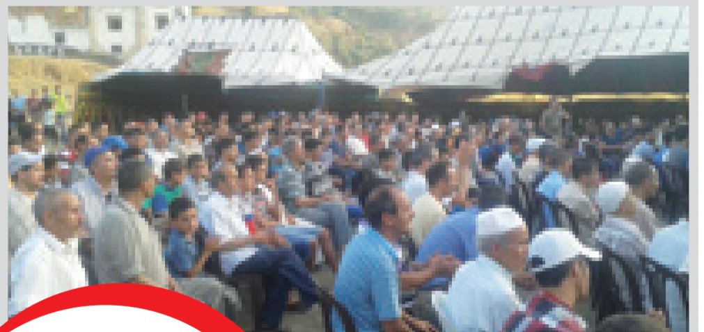
جمهور غفير تابع المهرجان الأول لأولاد أزام

لقد استطاعت قرية أولاد أزام بهذا الملتقى الذي نظمته مؤسسة أولاد أزام للتكافل والإنماء»، والذي التف حولها أبناء القرية من الداخل والخارج وبمختلف شرائحهم وفئاتهم، أن تخرج من دائرة النسيان الذي جعلها من القرى المغربية الأكثر هشاشة.