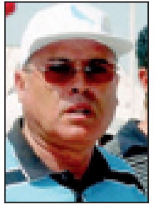
وكيل لائحة الحمامة