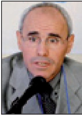
وكيل لائحة المصباح