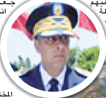
قائد عين عائشة مع فاعلين جمعويين وفي الإطار الحموشي

الإرهابي ضد المملكة، سبق وأن أقمن بهذه البؤرة المتوترة قبل إعلان موالاتهن لـ «داعش» وسيتم تقديم المشتبه فيهم إلى العدالة فور انتهاء البحث الذي