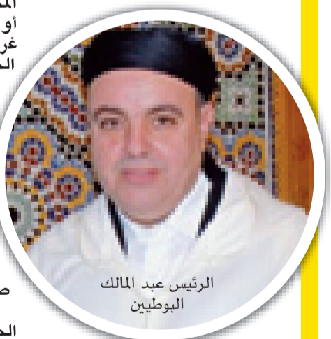
الرئيس عبد المالك البوطيين

التقليدية بفاس صباح يوم الإثنين 17 غشت 2015، عبد المالك البوطيين عن حزب الحركة الشعبية رئيساً لغرفة الصناعة التقليدية لجهة فاس- مكناس بأغلبية ساحقة.