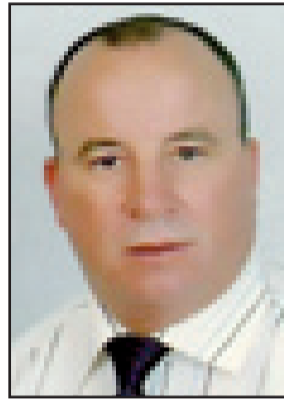
وكيل لائحة الجرار